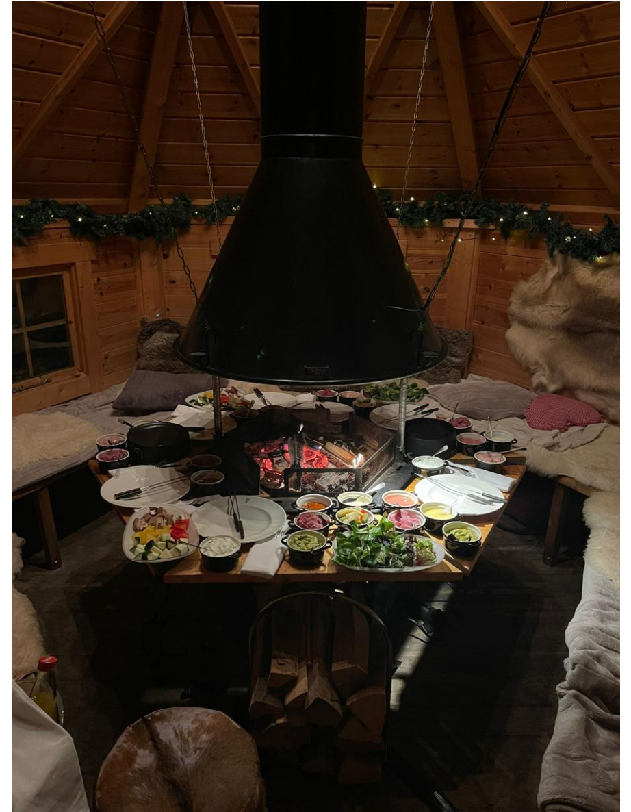
FONDUE IN DER KAMINHÜTTE ALS IMPRESSION

€ 93,00 pro Person inkl. Empfangsgetränke und Hüttenschnittchen, 5 Stunden Getränkepauschale sowie angebotene Speisenvariante